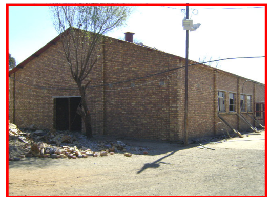
KOMBUIS GEBOU III: Die voltooië struktuur. Werkers is tans besig met pleistering sowel as die aanlê van water en elektrisiteit.