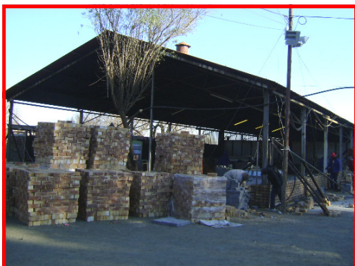
KOMBUIS GEBOU I: Sinkstruktuur is afgebreek en word vervang deur bakstene.