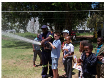
Leerlinge van ACA besig om meer te leer oor veiligheid