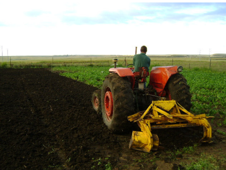
Johan Fourie besig om beddings te maak vir planting

Die implement is Vrydag, 27 Februarie, ingewy en daar is nie 'n lekkerder reuk as vars omgeploegde grond nie!