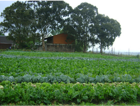
Groente opbrengs in Desember 08

per dag waarvan die Sendingkombuis ook voorsien word. Die hartseer is dat almal die gevolg van die swak ekonomie voel. Gereelde melkkopers kan nie meer die aankoop van melk bekostig nie - selfs nie teen R4.50 per liter nie. Daar word daaglik melk by kleuterskole en snoepwinkels afgelewer, sowel as aan privaat individue verkoop. Die melkverkope dien ook as 'n wonderlike geleentheid om die Goeie Nuus te deel.