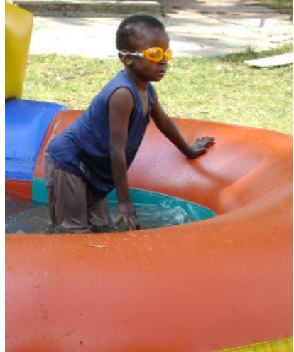
Ernstige swemmers dra duikbrille!