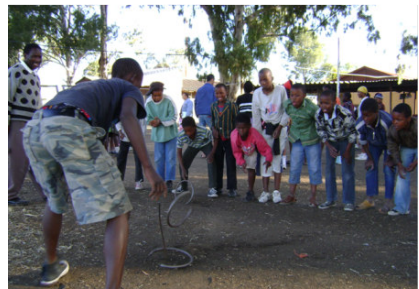
'n Seunspan moedig mekaar aan

GEBEDSVERSOEK: Bekering en Lewendige verhoudings met Jesus. Dat die kamp as platform vir jongmense wat 'n Oorgawe gemaak het sal dien.