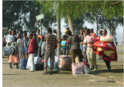
Kampkinders met hul bagasie