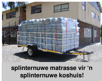
splinternuwe matrasse vir 'n splinternuwe koshuis!

Beide die seuns- en meisies-koshuise het splinternuwe matrasse ontvang.