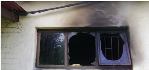
Die kampkamer se venster