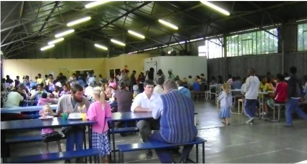
Die Sendingkombuis is tans 'n gebou van sink. Ons bid vir 'n gebou van stene