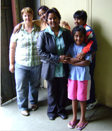
Die vrouespan wat ons bedien het

Op Donderdag 26 Februarie het 'n vrouespan vir die hele sending 'n heerlike ete voorberei. Ons het soos konings aan hierdie liefdesmaal gedeel.