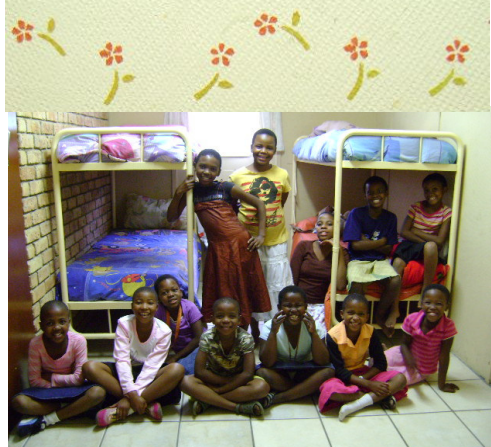
Meisies in een van hul nuwe koshuiskamers op die boonste verdieping

Die nuwe meisieskoshuis is Sondag 11 Januarie met sang en gebed ingewy. Ons is die Heer so dankbaar vir al die handewerk, ure, toewyding, liefde, materiaal, donasies en opoffering wat in die oprig van die meisieskoshuis gegaan het.