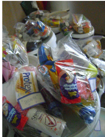
Gesinne en kinders het 'n heerlike groot geskenkpak ontvang

kersnaweek geboek en het ure van heerlike speel gegee. Kinders het gekraai van genot - van sonop tot sononder!