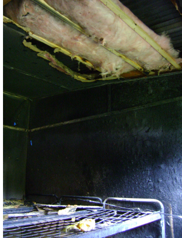
Die plafon het nog lank ná die brand gesmeul

Gedurende 'n aanddiens het 'n kampkamer aan die brand geraak. Niemand was ten tyde van die brand in die kamer nie. Groot skade is wel aan die plafon, mure en matrasse aangerig. Ons is dankbaar dat niemand in beide gevalle beseer is nie.