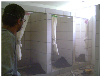
Pypherstelwerk in die badkamer van die nuwe meisieskoshuis

GEBEDSVERSOEK: Hartsverandering van persone wat oornag en of bly sowel as verantwoordelikeheidsin en oppassendheid.