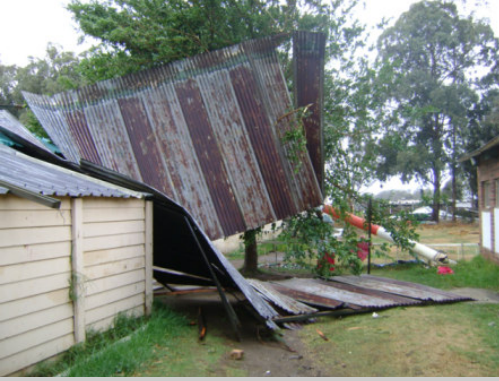
Sinkdakke is afgewaai