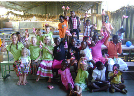
Al ons lekkergoed het ons eie name op!

kersnaweek geboek en het ure van heerlike speel gegee. Kinders het gekraai van genot - van sonop tot sononder!