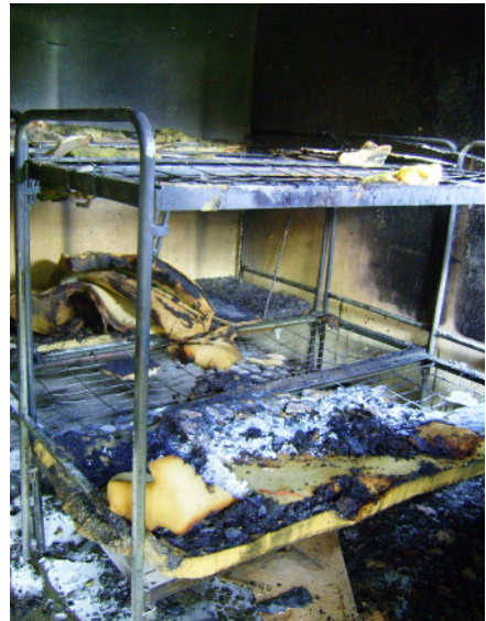
Alles is in puin gelê