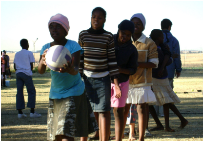
'n Meisiespan sit punte op die telbord

GEBEDSVERSOEK: Volharding en vrug op die werk. Bid dat kinders en volwassenes 'n oorgawe vir die Here sal maak en 'n verandering in die gemeenskap sal plaasvind. Bid ook vir beskerming waar hulle weekliks groot distansies in dikwels onveilige gebiede moet aflê