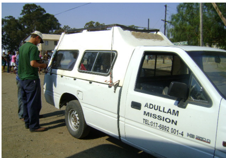
Vervoer vir Sondagbesoekers

Sondae word kinders en volwassenes in informele nedersettings gaan haal om die oggenddiens by te woon. Na afloop van die diens, word besoekers met 'n ete uit die sendingkombuis bedien waarna hulle weer by hul huise terugbesorg word.