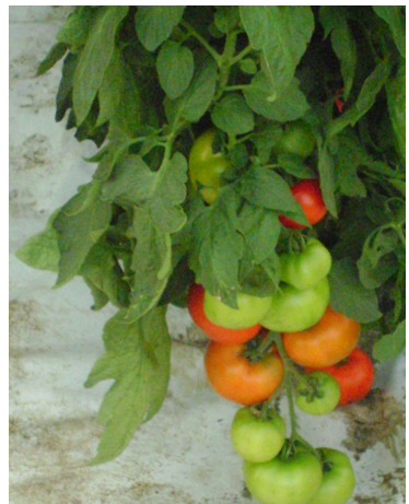
Tamaties in die groentetunnel

GEBEDSVERSOEK: Arbeiders en die geleentheid om die vierde tonnelstruktuur op te rig.